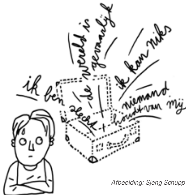
Afbeelding: Sjeng Schupp

De metafoor van de onzichtbare koffer kan de leerkracht helpen om met meer compassie naar een kind te kijken. Elk kind komt op school met een onzichtbare koffer vol overtuigingen en verwachtingen over zichzelf, de ander en de wereld. Kinderen die in hun eerste levensjaren onder voorspelbare en veilige omstandigheden zijn opgegroeid, hebben veelal positieve overtuigingen en verwachtingen in hun koffer, zoals 'ik ben de moeite waard' en 'anderen zijn te vertrouwen'. Veel getraumatiseerde kinderen komen met een koffer met minder helpende overtuigingen en verwachtingen, zoals 'ik ben een slecht kind' en 'anderen zijn niet te vertrouwen'. In de klas kan dit leiden tot lastige situaties waarin een kind soms lijkt te vragen om bevestiging van zijn negatieve overtuigingen en verwachtingen. Leerkrachten, (pleeg)ouders en (intern) begeleiders kunnen samen in gesprek gaan over de inhoud van de koffer van een kind. Op die manier kunnen ze het gedrag van dat kind beter begrijpen en wordt het risico dat een begeleider of leerkracht het gedrag zich persoonlijk aantrekt kleiner.